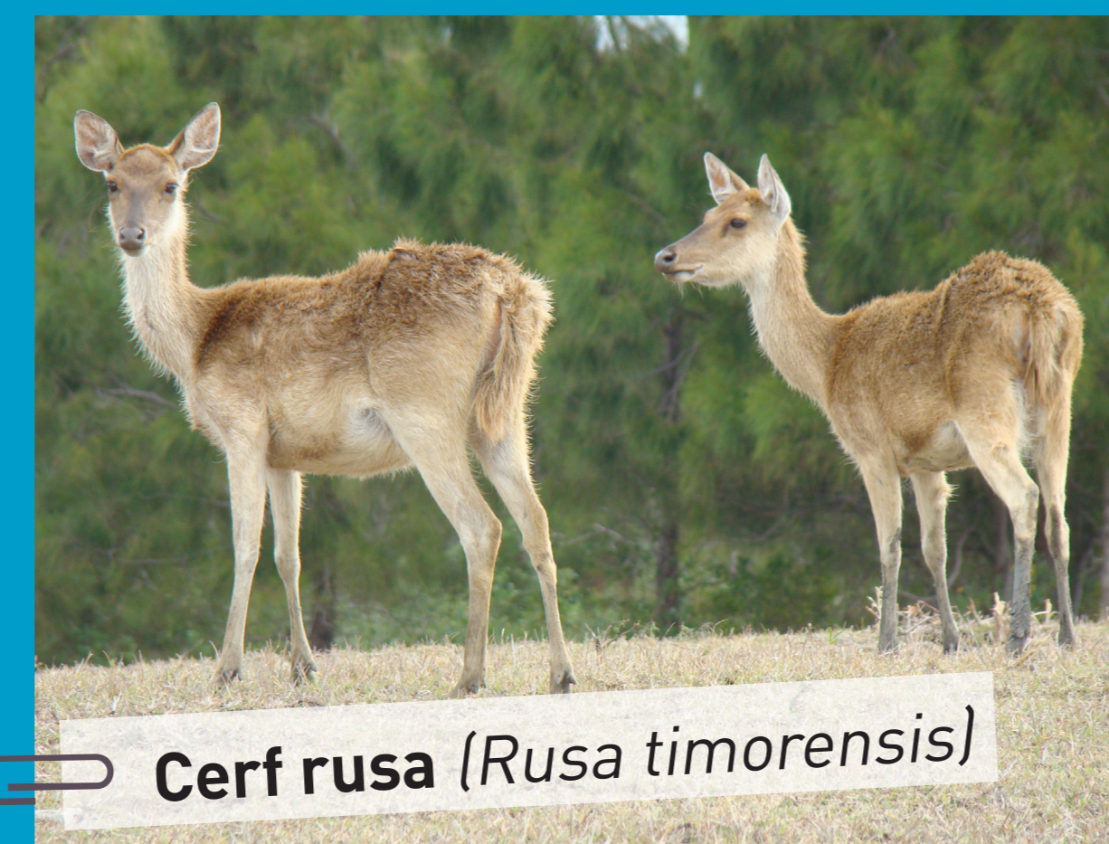
Cerf rusa ( Rusa timorensis )

Sur le domaine de Déva et sur plusieurs autres sites en Nouvelle-Calédonie, des mises en défens ont été installées pour préserver les plus belles reliques de forêt sèche particulièrement menacées.