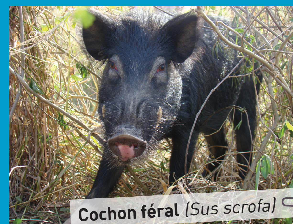
Cochon féral ( Sus scrofa )