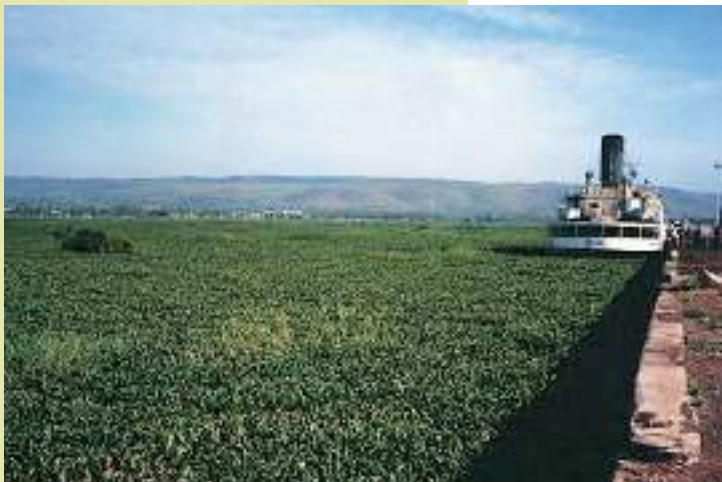
Jacinthe d'eau dans le Lac Victoria