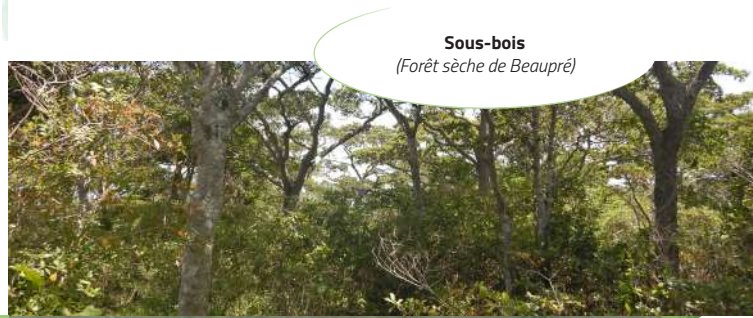
Sous-bois (Forêt sèche de Beaupré)

C'est aujourd'hui une petite forêt isolée, entourée de pâturages . Protégée depuis 2003, la forêt sèche (5 ha) se développe à l'abri des dégradations du bétail et des cerfs au sein d'une mise en défens de 9,5 ha.