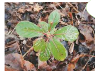
Terminalia cherrieri (EN)

La gestion du site de Beaupré permet également la conservation de populations d'espèces rares et menacées. Archidendropsis paivana et Terminalia cherrieri (Badamier de Poya), deux espèces respectivement vulnérable et en danger d'extinction, inscrites sur la liste rouge de l'UICN, en sont les principales représentantes.