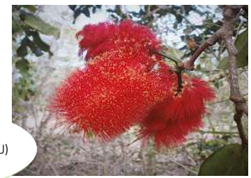
Archidendropsis paivana (VU)