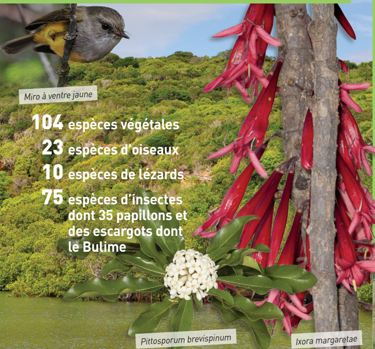
Miro à ventre jaune