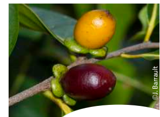
Diospyros fasciculosa Faux caféier

La forêt sèche littorale de Malhec, seul site mis en défens au Nord de la Grande Terre, constitue un véritable refuge pour la faune et la flore. Les étendues d'eau temporaires lui confèrent un aspect singulier au sein du réseau des forêts sèches préservées. La gestion du site de Malhec permet la protection de populations d'espèces végétales endémiques protégées par le code de l'environnement de la province Nord ( Cupaniopsis trigonocarpa , Diospyros fasciculosa ). Certaines espèces végétales rares et menacées, dont la régénération naturelle reste à confirmer, ont fait l'objet de plantations dans le périmètre protégé entre 2008 et 2013 ( Ixora margaretiae , Pittosporum brevispinum , Terminalia cherrieri ).