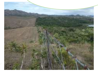
Lisière de forêt sèche protégée et pâturages