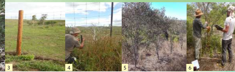
3 4 Protection physique et entretien 6 Suivi de la flore 5 Plantation en lisière de forêt sèche