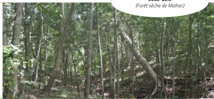
Sous-bois (Forêt sèche de Malhec)

Protégée depuis 2002 , la forêt sèche (27 ha) se développe à l'abri des dégradations du bétail et des cerfs au sein d'une mise en défens de 61 ha.