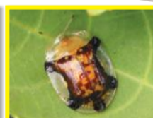
( Aspidomorpha quinquifasciata )