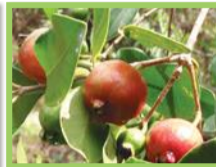
Goyavier de Chine ( Psidium cattleianum )