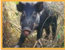
Cochon féral ( Sus scrofa )