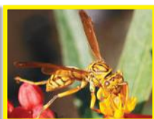
Guêpe jaune ( Polistes olivaceus )