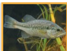
Black bass ( Micropterus salmoides )