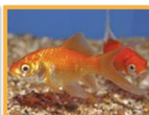
Carpe japonaise ( Carassius auratus )