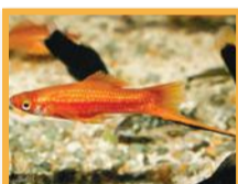
Xypho - Porte-épée ( Xiphophorus hellerii )