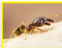
Fourmi noire à grosse tête ( Pheidole megacephala )