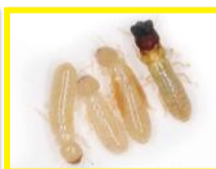
Termites du bois sec ( Cryptotermes brevis )