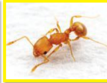
Fourmi électrique ( Wasmannia auropunctata )