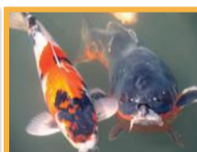
Carpe Koi ( Cyprinus carpio carpio )