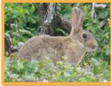
Lapin européen ( Oryctolagus cuniculus )