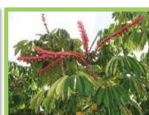
Arbre pieuvre ( Schefflera actinophylla )