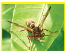
Guêpe brune ( Polistes stigma townsvillensis )