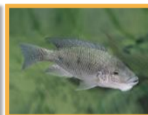
Tilapia du Mozambique ( Oreochromis mossambicus )