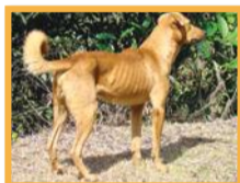
Chien féral ( Canis familiaris )