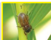
Hanneton défoliateur ( Adoretus versutus )