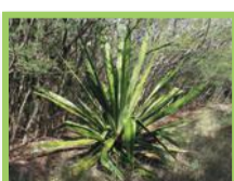
Grand aloès ( Furcraea foetida )