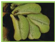
Salvinia - Fougère d'eau ( Salvinia molesta )