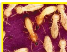
Termites à béton ( Coptotermes grandiceps )