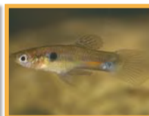
Guppy ( Poecilia reticulata )