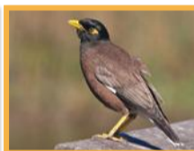
Merle des Moluques ( Acridotheres tristis )