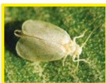
Aleurode spiralante ( Aleyrodicus dispersus )