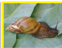
Achatine ( Achatina fulica )