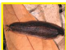
( Laevicaulis alte )