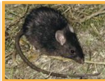
Rat noir ( Rattus rattus )