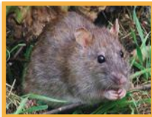
Rat surmulot ( Rattus norvegicus )