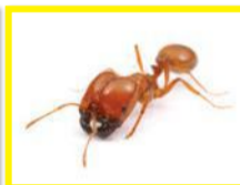
Fourmi rouge ( Solenopsis geminata )