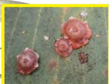
Cochenille rose ( Ceroplastes rubens )