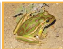
Rainette verte et dorée ( Ranoidea aurea )