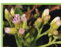
Vergerette indienne ( Pluchea indica )