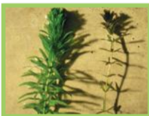
Elodée de Floride ( Hydrilla verticillata )