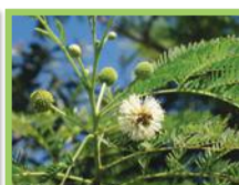
Faux mimosa ( Leucaena leucocephala )