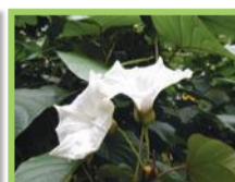
( Merremia peltata )