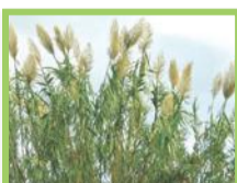
Canne de Provence ( Arundo donax )