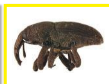
Charaçon des orchidées ( Orchidophilus aterrimus )