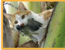
Chat haret ( Felis catus )