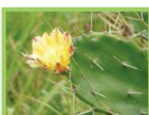
Figuier de Barbarie ( Opuntia stricta )