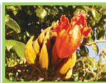
Tulipier du Gabon ( Spathodea campanulata )