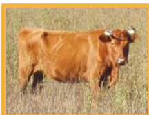
Vache ensauvagée ( Bos taurus )