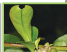
Vigne de Madère ( Anredera cordifolia )