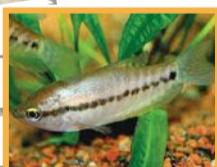
Gourami à peau de serpent ( Trichogaster pectoralis )