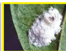
( Pulvinaria urbicola )