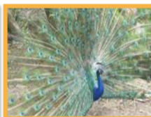
Paon bleu ( Pavo cristatus )