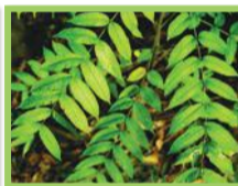
Acajou amer ( Cedrela odorata )