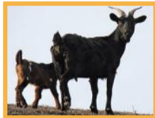
Chèvre férale ( Capra hircus )