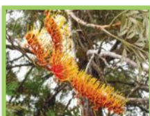
Grevillea - arbre de soie ( Grevillea robusta )