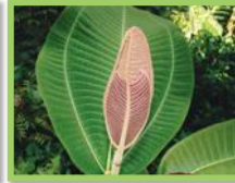
Miconia ( Miconia calvescens )