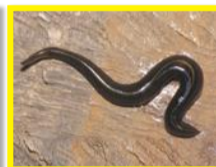
Ver plat de Nouvelle-Guinée ( Platydemus manokwari )