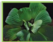
Laitue d'eau ( Pistia stratiotes )