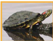
Tortue de Floride ( Trachemys scripta )