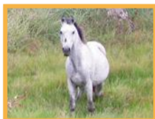
Cheval ensauvagé ( Equus caballus )