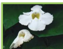
( Thunbergia grandiflora )