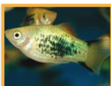
Platy ( Xiphophorus maculatus )