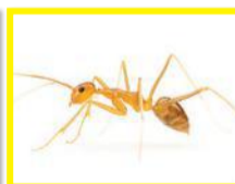
Fourmi folle jaune ( Anoplolepis gracilipes )