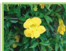
Griffe de chat ( Macfadyena unguis-cati )