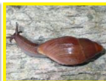
Euglandine rose ( Euglandina rosea )