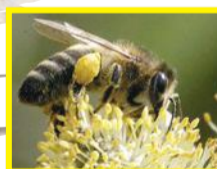
Abeille domestique ( Apis mellifera )