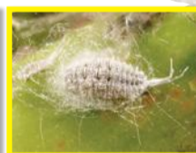
Cochenille striée ( Ferrisia virgata )