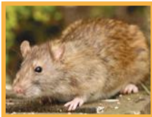
Rat du Pacifique ( Rattus exulans )