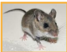
Souris grise ( Mus musculus )