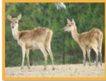
Cerf rusa - Cerf de Java ( Rusa timorensis russa )