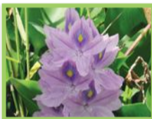
Jacinthe d'eau ( Eichhornia crassipes )