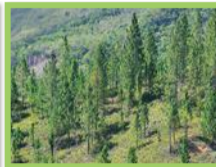
Pin des Caraïbes ( Pinus caribaea )