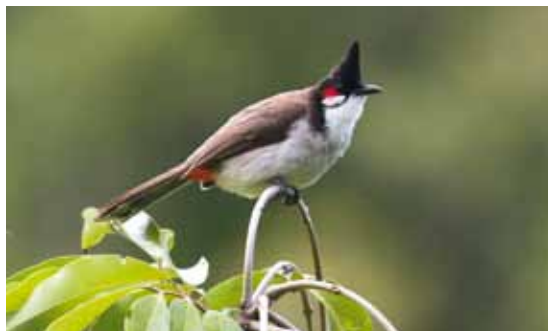
© S. Caceres et J.N Jasmin